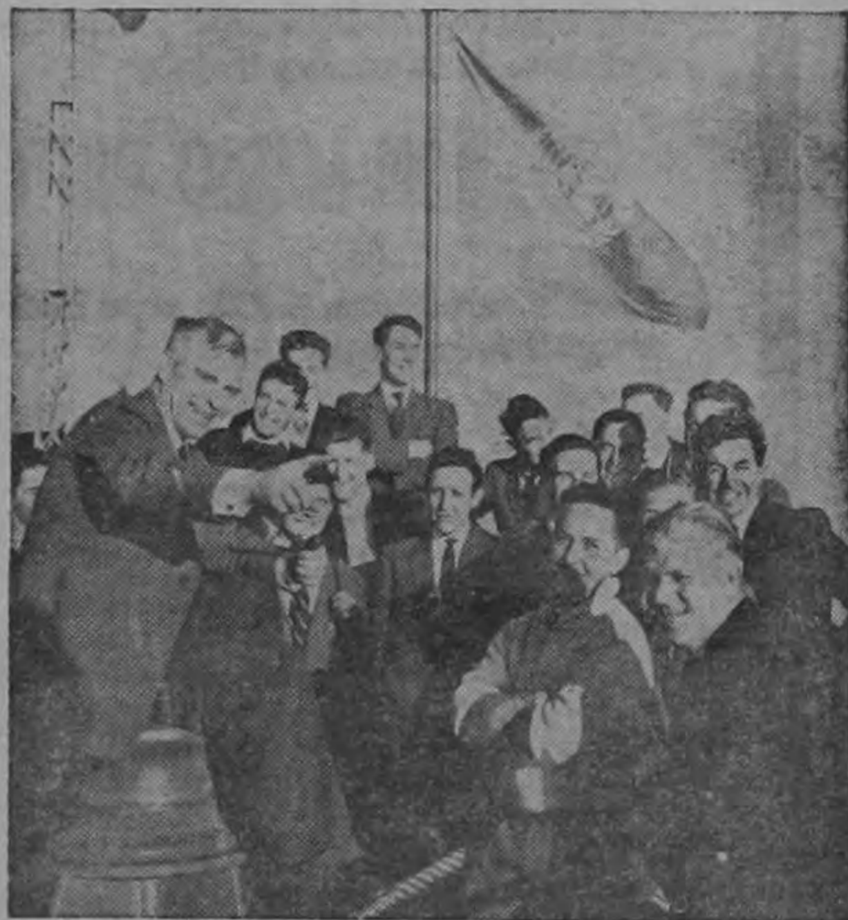
Sir Vivian Fuchs, el famoso explorador antártico y director de la Comisión Hidrográfica de las Dependencias de las Islas Falkland, se despide de los jóvenes científicos y técnicos británicos al partir éstos hace poco desde Inglaterra para incorporarse a dicha Comisión.